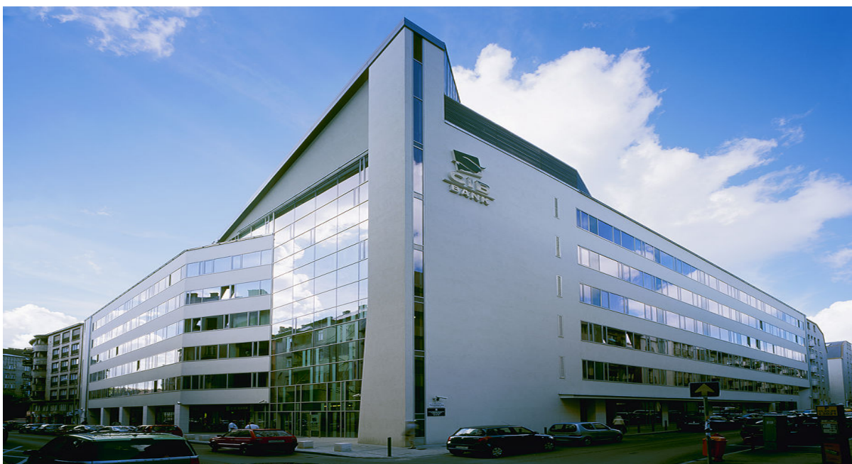
Проект: Офисное здание Light Corner, Будапешт, Венгрия

Больше света. Меньше нагревания. Выше энергосбережение.