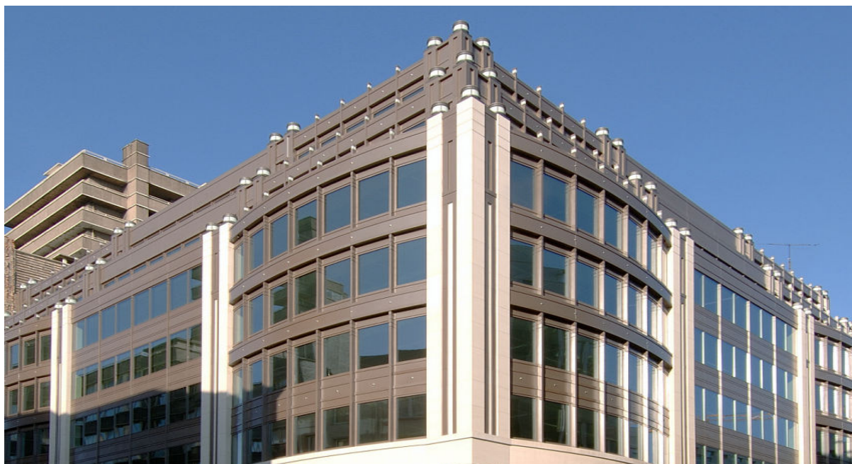
Проект: Люксембург 40, Брюссель, Бельгия

Больше света. Меньше нагревания. Выше энергосбережение.