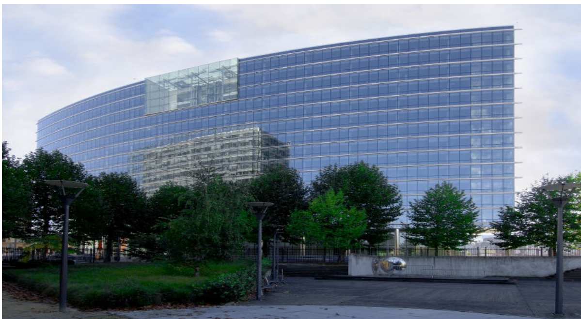
Проект: Комплекс Lex 2000, Брюссель, Бельгия

Больше света. Меньше нагревания. Выше энергосбережение.