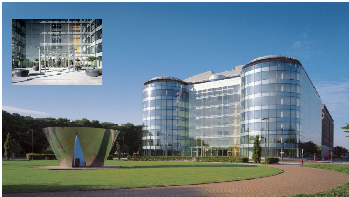
Проект: Внутренний двор гостиницы Olympiades Marriott, Брюссель, Бельгия