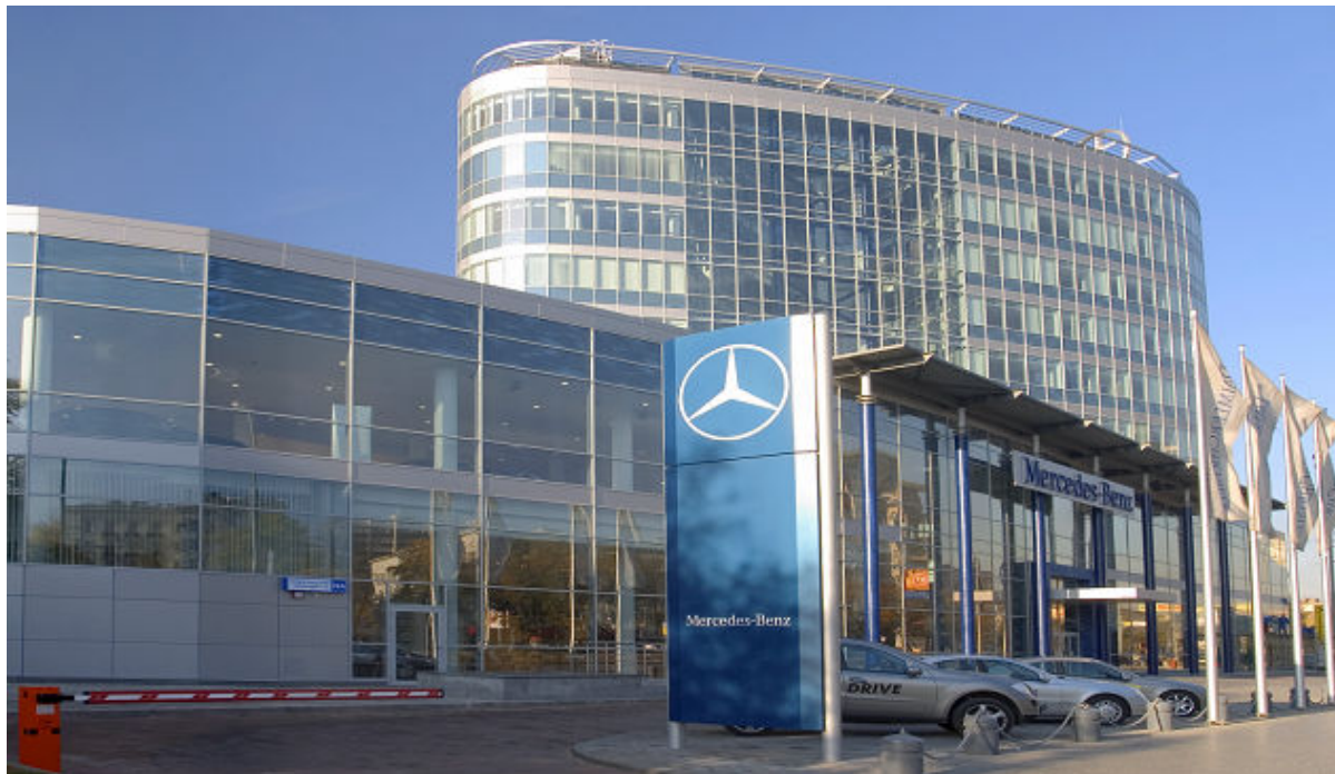
Проект: Здание Mercedes Benz Plaza, Москва, Россия