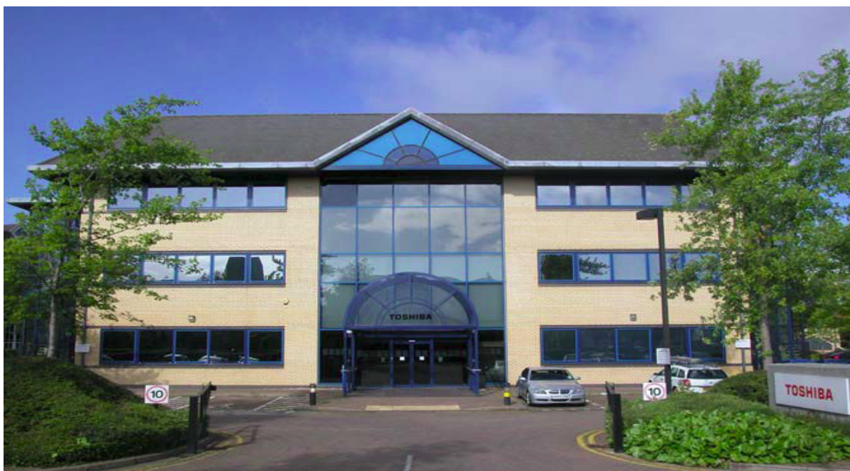
Проект: Офис компании Toshiba, Германия

ЗАЩИТА ОТ СОЛНЦА И ВОПЛОЩЕНИЕ ТВОРЧЕСКИХ ИДЕЙ